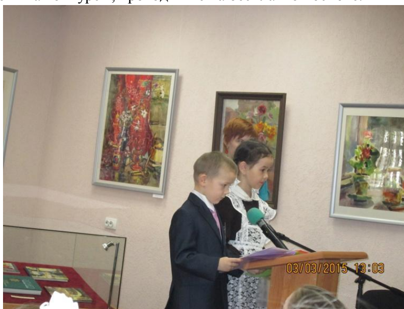
Рисунок 2. Республиканская научно-практическая конференция для школьников

Для участия в конкурсах, как правило, необходимо оплатить организационные взносы, что ограничивает возможность участия каждого желающего ребенка. Поэтому сейчас я делаю акцент на конкурсы, проводимые на бесплатной основе.