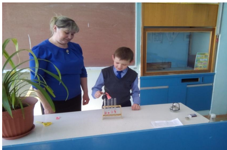
Рисунок 3. Выполнение социального проектного задания

Прошлый учебный год открыл для нас конкурсы как «Моя семейная реликвия». Творческий конкурс «У природы есть друзья: это мы – и ты, и я!». Конкурс изобразительного искусства и художественно-прикладного творчества «Юные дарования» в рамках XX Международного фестиваля «Детство без границ». Республиканский конкурс детских рисунков «Профессия будущего». Межрегиональный конкурс творческих и проектных работ учащихся «Династии России» и Республиканский детский фестиваль-конкурс народного творчества «Без бергэ».